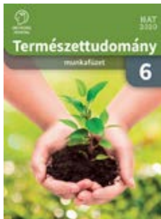
Természettudomány 6. munkafüzet