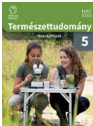
Természettudomány 5. munkafüzet