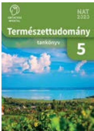
Természettudomány 5. tankönyv

OH-TER05MA: A korábbi FI-505020502/1 raktári számú 5. osztályos munkafüzet (Tananyagfejlesztők: Kropog Erzsébet, Láng György, Mándics Dezső, Molnár Katalin, Ütőné Visi Judit) átdolgozása a NAT 2020 kerettantervi előírásoknak megfelelően.