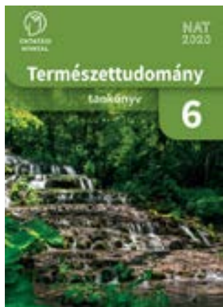
Természettudomány 6. tankönyv