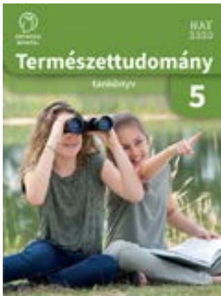
Természettudomány 5. tankönyv