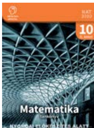
Matematika 10. tankönyv II. kötet