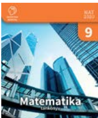
Matematika 9. tankönyv

OH-MAT09TA/I és OH-MAT09TA/II : Matematika 9. tankönyv (tananyagfejlesztők: Tamásné Kollár Magdolna, Kelemen-Kiss Ilona) a korábbi FI-503010901/1 és a FI-503010901/1 kódú tankönyv (szerzők: Barcza István, Basa István, Tamásné Kollár Magdolna, Bálint Zsuzsanna, Kelemenné Kiss Ilona, Gyertyán Attila, Hankó Lászlóné) átdolgozása a NAT 2020 kerettantervi előírásoknak megfelelően. A tankönyv elérhető az nkp.hu portálon.