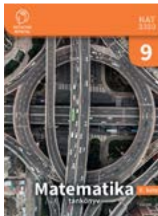
Matematika 9. tankönyv II. kötet