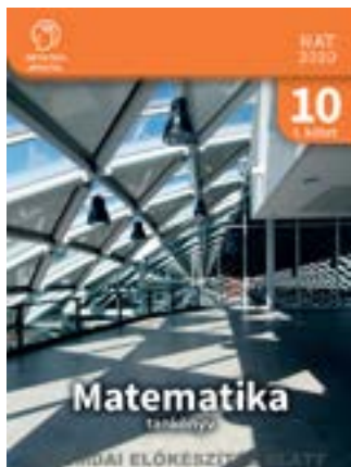
Matematika 10. tankönyv I. kötet