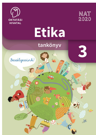
Etika tankönyv 3. Beszéljessünk!