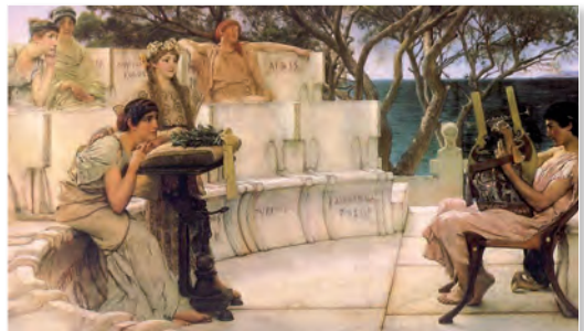
Lawrence Alma-Tadema [lőrens elmő-tedima]: Szapphó és Alcaeus (1881)