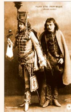
◆ Színpadi jelenet (20. század eleje)