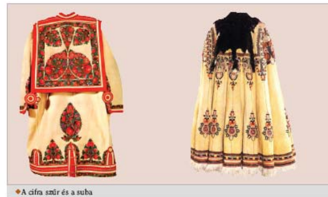
♦ A cifra szőr és a suba

A János vitéz ben sok olyan kifejezéssel, fordulattal vagy mondással találkozunk, amely a népnelvből származik. Ezek színessé, életszerűvé teszik a művet. Olyan a hatásuk, mintha egy juhászlegény vagy egy messze földről hazatért katoná mesélné hallgatóinak erősen kiszínezett kalandjait. Petőfi gazdag képzelete, mesemondó készsége számos olyan költői eszközzel gyarapította a népmesékre emlékeztető előadásmódot, amely az ő költői leleménye.