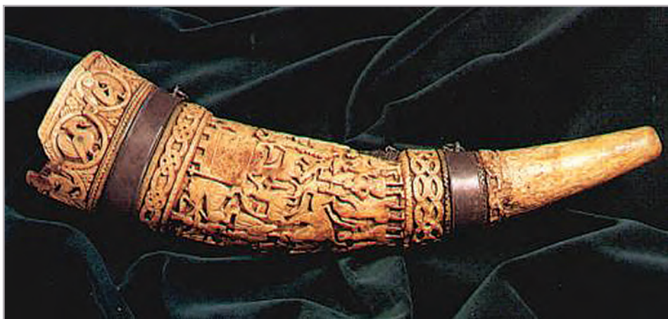
◆ Ósmagyar kürt, „Lehel kürtje”

A monda feldolgozási formái ► A kalandozás és a honfoglalás korából származó mondákat a középkori latin nyelvű krónikák őrizték meg. Egy részük a nép ajkán is fennmaradt, és új elemekkel bővült.