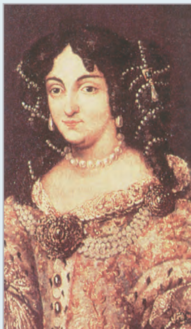
◆ Zrínyi Ilona (olajfestmény, 18. század eleje)

Közben teltek a hónapok, és a környékbeli parasztemberek csakúgy megművelték a földet, mint az előbbi években. Amikor az aratás ideje eljött, éppen aratni készültek, pedig a vár körül csak úgy nyüzsgött a sok labanc.