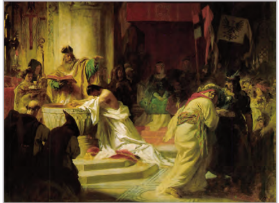
◆ Benczúr Gyula: Vajk megkeresztelése (1870)

Verselés ► Mint már tanultunk róla, két verselési rendszer van jelen a magyar költészetben: az időmértékes és az ütemhangsúlyos . A Himnusz mindkét verselési rendszerben értelmezhető, mert a sorok ütemekre is felbontathatók, és ugyanakkor a trocheikus verslábak ritmusát is érezzük. Ráadásul a sorok rímelnek is, ami eléggé ritka, mert az időmértékes versek általában rímtelenek. Ezt a sajátos formát rímes-időmértékes , vagy más néven nyugat-európai verselésnek nevezzük. Ismétlésként idézzük föl: az időmértékes verselés a rövid és a hosszú szótagok szabályos váltakozásán alapszik. Itt a hosszú és a rövid szótagok váltakoznak, ezt a verslábát nevezzük trocheusnak.