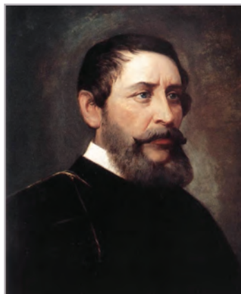
◆ Kossuth Lajos (ismeretlen festő)

A század elejének legjelentősebb költője, Berzsenyi Dániel (1776–1836) a reformokban már nem vállalt szerepet, de verseivel je-