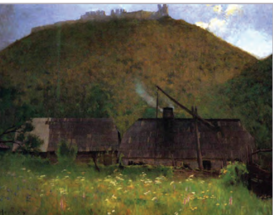
◆ Hollósy Simon: Huszt (1896)

ROMANTIKUS JELKÉP: A VÁRROM ► A 19. század első felében költők és festők közkedvelt témája a várrom. A régi dicsőség színhelye ez: végvári küzdelmeké, szabadságharcoké. Huszt Rákóczi idején, a kuruc háborúkban vált híressé.