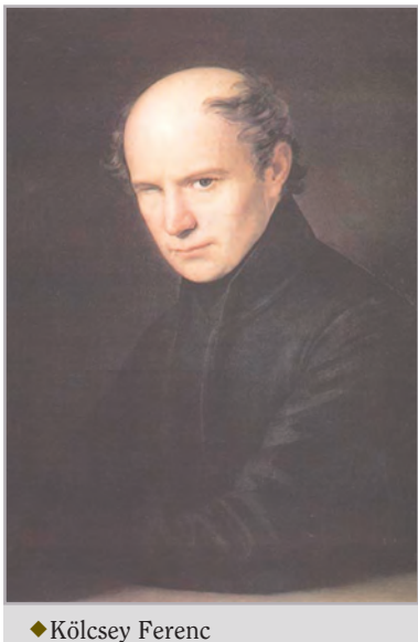
◆ Kölcsey Ferenc

„Hass, alkoss, gyarapíts, s a haza fényre derül!”