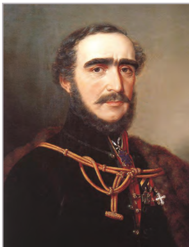
◆ Barabás Miklós: Széchenyi István (1848)

A reform fogalma ► 1825-től az 1848. március 15-én kezdődő forradalomig ível történelmünknek az a sikerekben gazdag korszaka, amelyet reformkornak nevezünk.