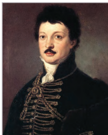
◆ Donát János: Berzsenyi Dániel (1817)