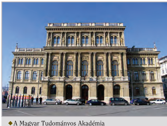
◆ A Magyar Tudományos Akadémia

ban indul Liszt Ferenc zeneszerző és zongoraművész fényes pályája. A forradalom iránti rokonszenvét kifejezik zongorára írt Magyar rapszódái , amelyek sorában a Rákóczi-indulót is feldolgozta. Erkel Ferenc , a Himnusz megzenésítője a szabadságharc után lett a nemzeti operairodalom első jelentős képviselője (legfontosabb operái a Bánk bán és a Hunyadi László ).