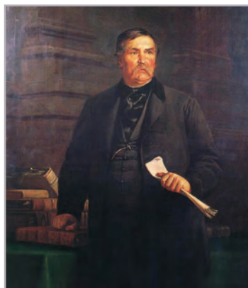
◆ Székely Bertalan: Deák Ferenc (1869)