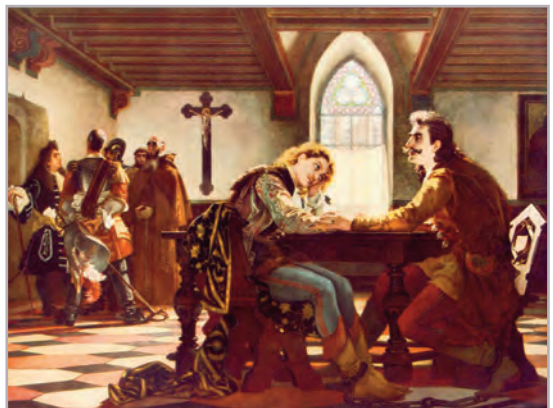
◆ Madarász Viktor: Zrínyi és Frangepán a bécsújhelyi börtönben (1864)

Mit gondolsz, miért volt kedvelt téma a 19. századi magyar festészetben a múlt eseményeinek megidézése? Keresd további, a magyar nép dicső múltját és a magyar nép megpróbáltatásait megjelenítő festményeket az interneten vagy művészeti albumban!