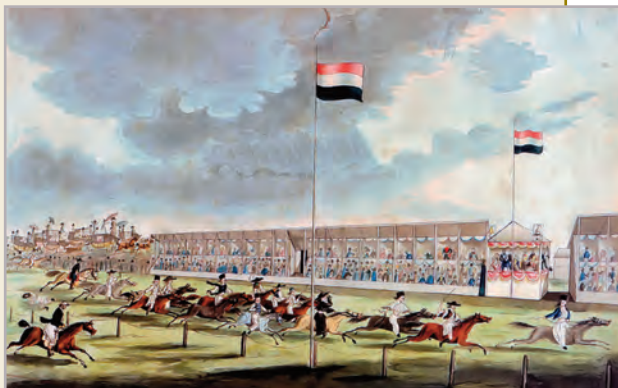
◆ Az első lóverseny 1827-ben (J. E. G. Prestel litográfiája)

Nyugat-Európát ugyanis számos körülmény segítette fejlődésében a mi régióinkhoz képest. Nem vetette vissza a török uralom, sőt, épp ellenkezőleg, a földrajzi felfedezések nyomán a világkereskedelem centrumává vált, és messze előttünk járt. Volt mit tanulniuk az Angliába, Franciaországba érkezőknek: itt rég nem volt