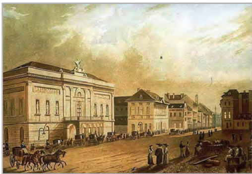
◆ Pesti Magyar Színház

lentősen hatott az országért felelősséget érző nemességre; Széchenyi gyakran idézte költeményeit.