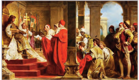
◆ Benczúr Gyula: Mátyás fogadja a pápa követeit – részlet (1915)