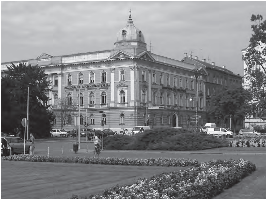
Lexikografski zavod Miroslav Krleža, Zagreb