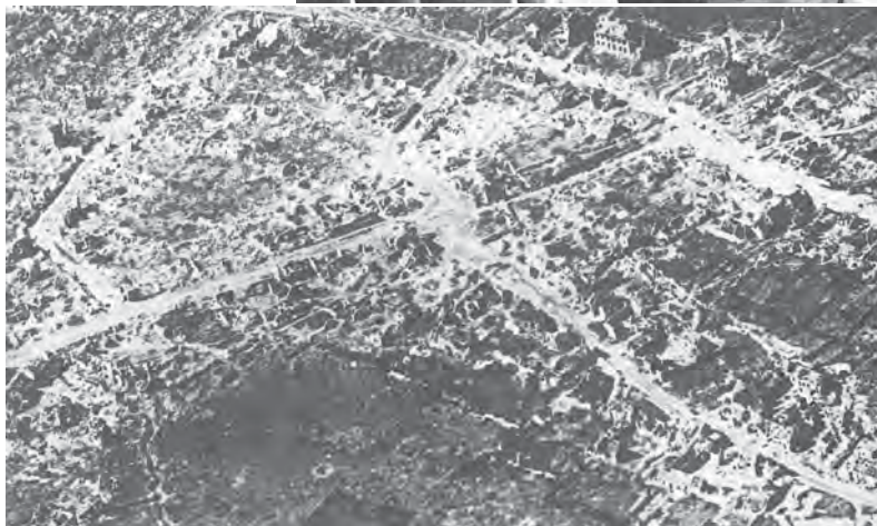
Снимак из ваздуха - разрушени град Лус