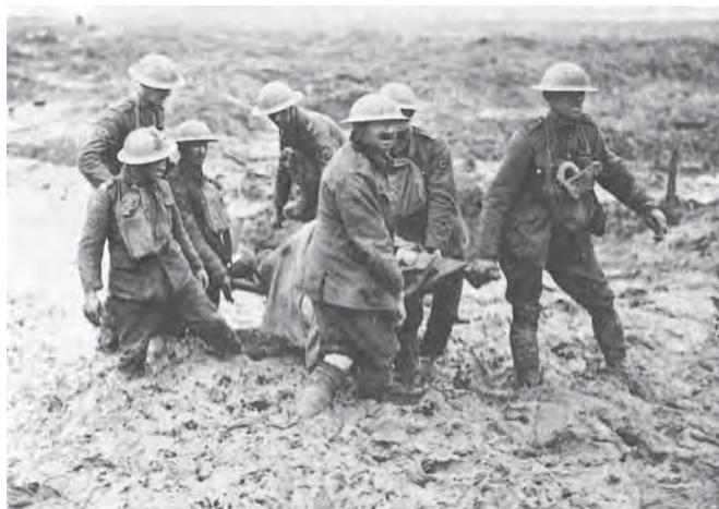
Пренос рањеника у Првом светском рату