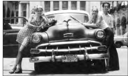
die drei Jugendlichen / in der Disco kennen lernen