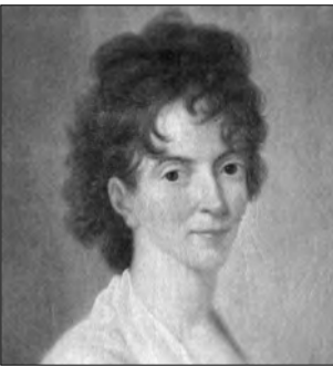
Mozarts Ehefrau (Konstanze)

Das ist das Haus, in dem Mozart geboren wurde.