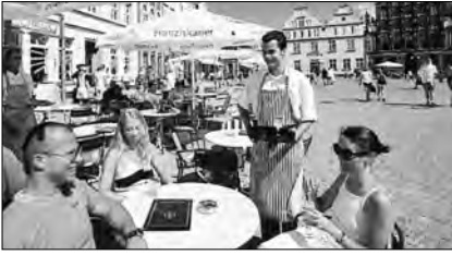
das Café „Marimar“ /nachmittags/ / Kaffee trinken / in Greifswald