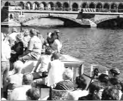
Stadtrundfahrt / per Schiff / in Berlin teilnehmen