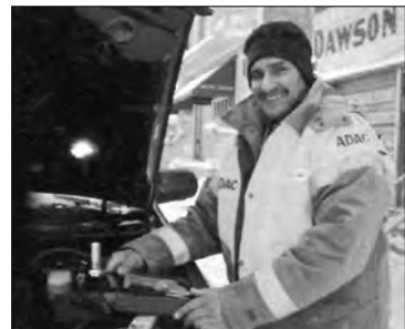
Der Gelbe Engel * /Benzin/ bekommen