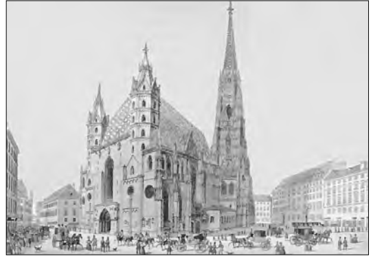
Trauung* im Stephansdom (1782)