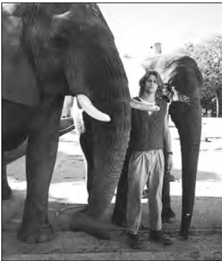
Elefant / sitzen / Safari-Park