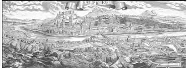
Salzburg – die Geburtsstadt*