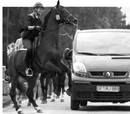
Pferde / sich treffen / unterwegs